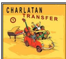
Le premier disque